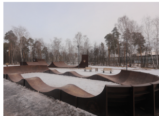
Дзержинск, Нижегородская область, 2020 Благоустройство парка «Утиное озеро», ставшего красивой, грамотно зонированной территорией для комфортного отдыха горожан всех возрастов