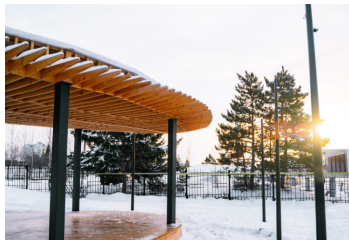
Покровск, Якутия, 2020 Благоустройство набережной: спортивная площадка с тренажерами, скейтпарк, зона релакса, смотровые площадки, велодорожка по всему периметру