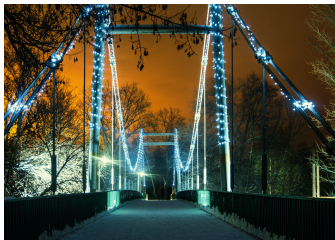
Мичуринск, Тамбовская область, 2020 Строительство ландшафтного парка-набережной: обустроены велодорожки, построены пешеходные зоны, новый облик обрели пляжи